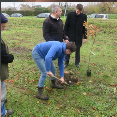
Turbo Bosquet Plantation d'arbres