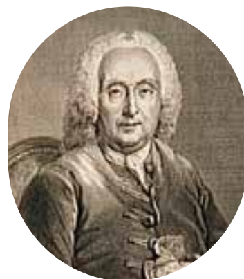
Portrait de Jean-Baptiste Moreau